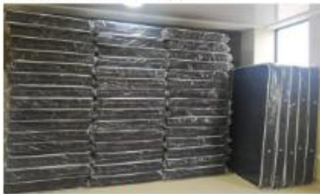
COLCHON DE 1 1/2 PLAZA